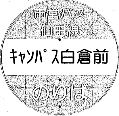
バス停留所看板イメージ図