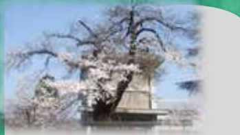
キャンパス白倉 : 旧白倉小学校を活用した交流施設で、宿泊も可能です。詳細は川西支所へお問い合わせ下さい。