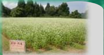
岩瀬体験農園 : 岩瀬集落の北側、トンネル手前の山道奥です。9月中旬頃のそばの花畑は必見です。