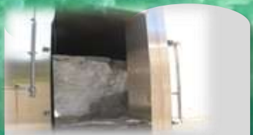
せんだの雪室 :『道の駅せんだ』に設置され、農産物貯蔵に利用されています。見学は予約が必要です。