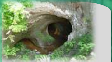
まぶ : 蛇行した川と川の間で直線的な新しいトンネル状の川を作り、水流を変えた隧(ずい)道です。