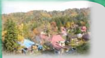
小白倉集落の景観 :『第5回美しい日本のむら景観コンテスト』で最優秀賞を受賞した原風景です。