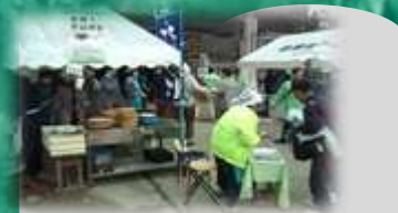
岩瀬そば祭り : 毎年11月中旬に開催されるそば祭り。ブランド品種『とよむすめ』が使用されます。