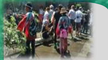
小白倉もみじ引き : もみじの木を祭礼後に倒して引き回す祭り。行列に水を浴びせかけて盛り上がります。